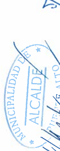
MUNICIPALIDAD DE PUENTE ALTO GERMAN CODINA POWERS ALCALDE